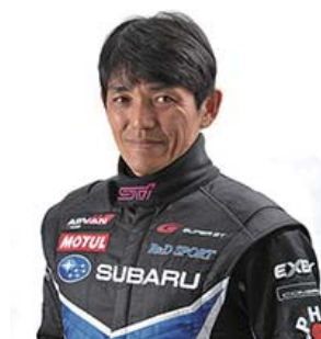
全日本ジムカーナ スーパーGTドライバー 山野哲也

コース外まで舗装されたDP那須だから、少しのコースオフならダメージはありません。思い切って愛車の限界にチャレンジできます。